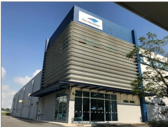
【エンジン整備工場】