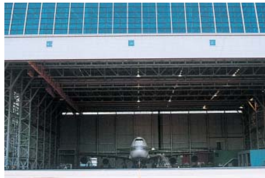
関西国際空港 大型機用格納庫