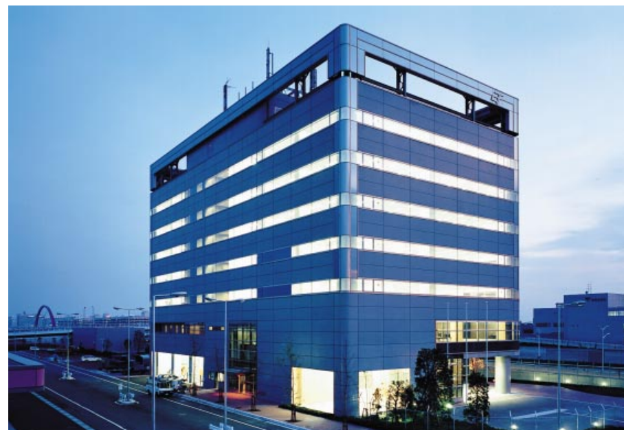
カーゴセンタービル